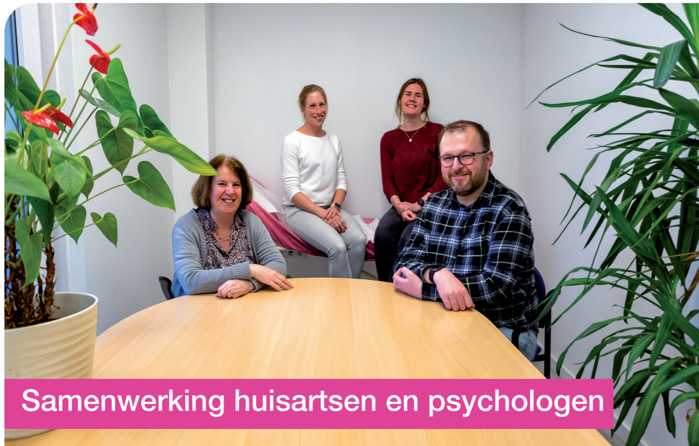
Samenwerking huisartsen en psychologen